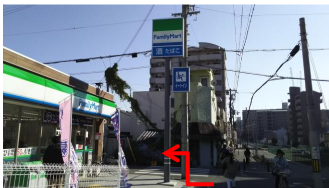
⑥ ファミリーマートさんの角を左折。