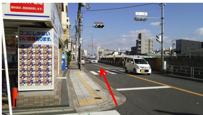
③ 「賃貸住宅」さんの角をまっすぐに。