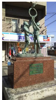
② 目の前にある「平和よ永遠なれ」方向に。