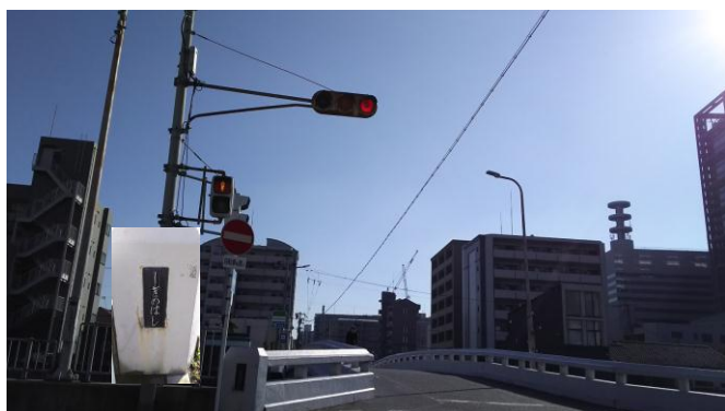
⑤ これが「しぎの橋」です。