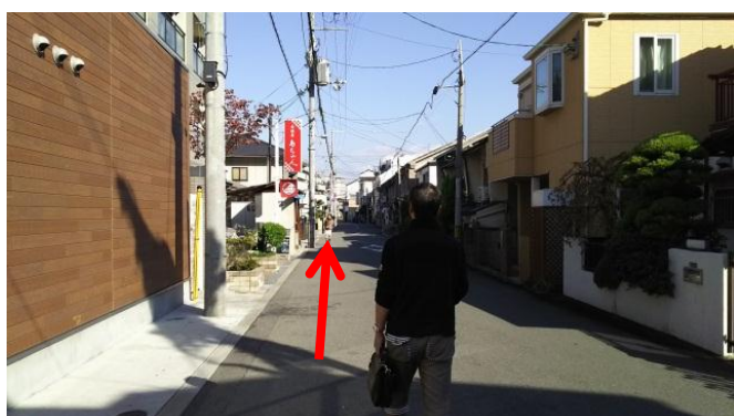
⑦ あとは、まっすぐ進むだけ。