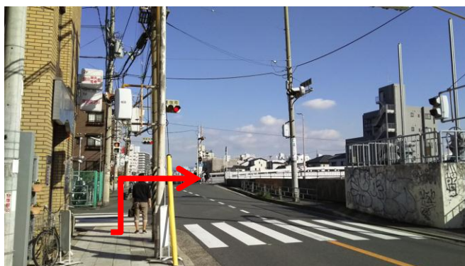
④ 2つ目の信号を「しぎの橋」側に渡ります。