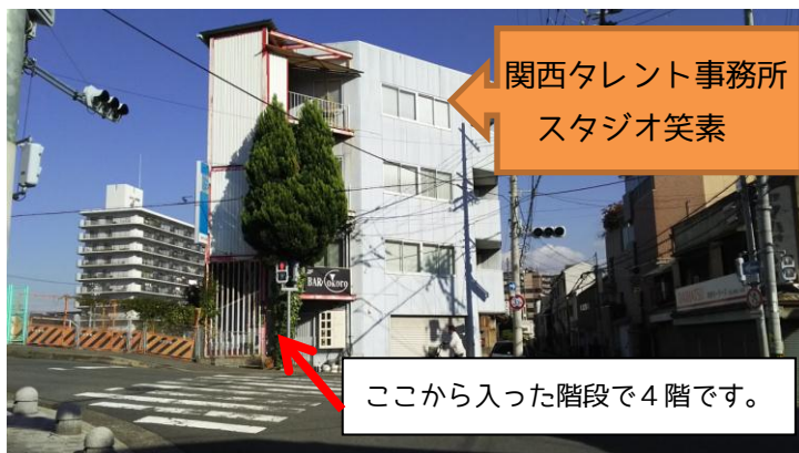
⑧ 目の前のこの建物の4階です。階段で上がってきてください。