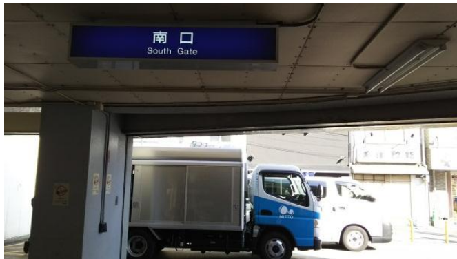
① JR「京橋」南口を出ます。